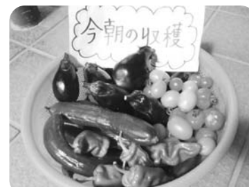
立派な野菜収穫できました!

畑で獲れた野菜は、デイサービスの昼食の食材に使っています。利用者さんが丹精込めて育てた野菜を食べて季節の味を感じながら、暑さを乗り切ります。