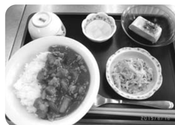
おいしくいただきました♪