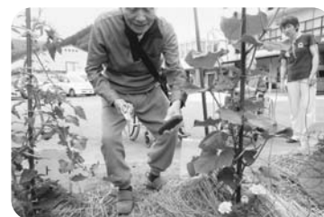
良いキュウリだな～!