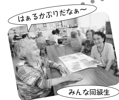
はあるかぶりだなあ～