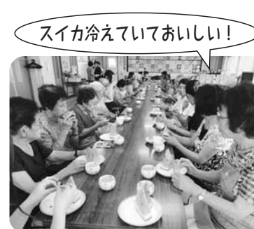
スイカ冷えていておいしい!

同級生、婦人会、日赤奉仕団で知り合ったなつかしい人達とのしばしの交流を楽しむ事ができました。