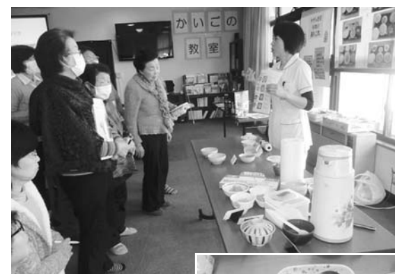
きざみ・とろみ食