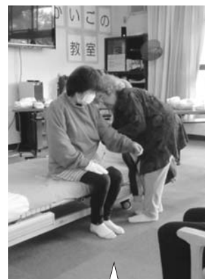
着脱介助実際にやってみると難しい…

第3回は2月14日「替えてさっぱり！オムツと着替え」と題し、社協職員が講師となり実演や実技もふまえながら行いました。正しい介護技術を知ること、介護者の方、介護を受けている方、双方の心身の負担軽減、また、介護を受けている方が協力動作を行うことで、身体機能の維持にもつながります。今回の教室で参加者の方のお悩みをお聞きし、解決できるきっかけになったと思います。全回通して62人の