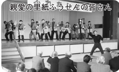
親愛の里紙ふうせんの皆さん

平成26年3月4日、第25回となる「山吹ふれあい広場」がやすらぎ荘大ホールにて開催されました。