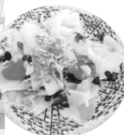
(白菜と市田柿の浅漬け)