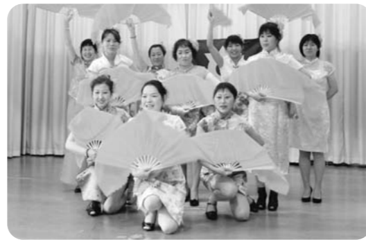
「日本語教室」のみなさん

続く懇親会では、アクションの日本舞踊・フラダンス・中国舞踊を鑑賞しながら会話も弾み、交流を深めることが出来ました。