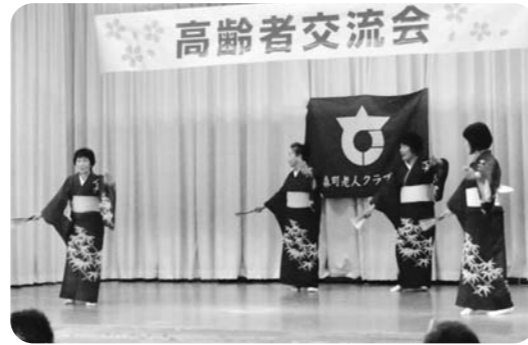
「すずらん」のみなさん