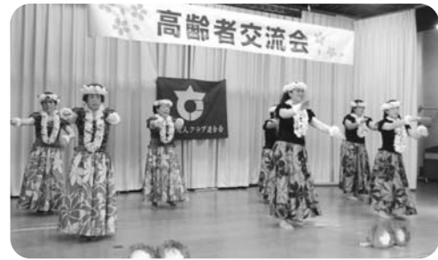
「フラサークル ルアナ」のみなさん

出席された方からは「地域のため自分自身の健康のため、これからも社会活動に参加していきたい。」と、元気な挨拶がありました。