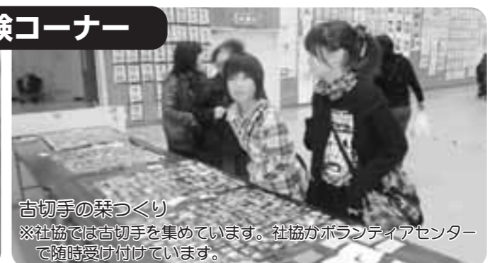
古切手の葉づくり ※社協では古切手を集めています。社協ボランティアセンターで随時受け付けています。