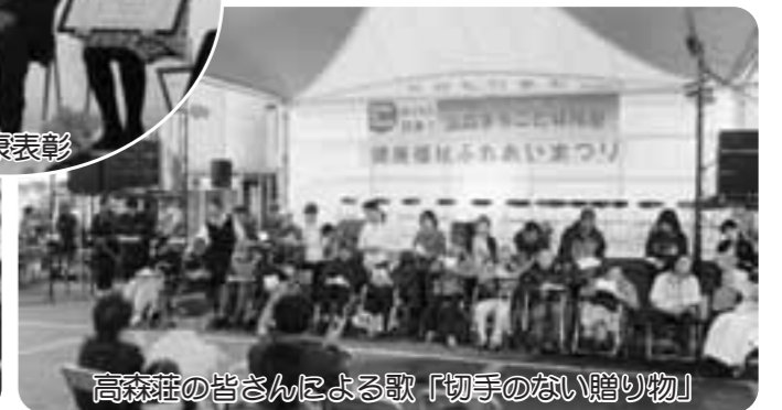
高森荘の皆さんによる歌「切手のない贈り物」