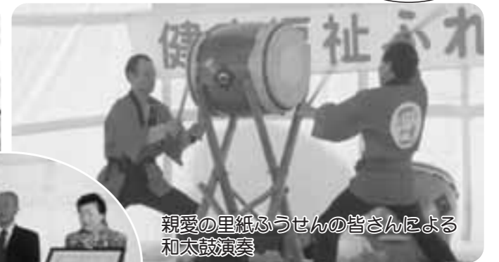
親愛の里紙ふうせんの皆さんによる和太鼓演奏