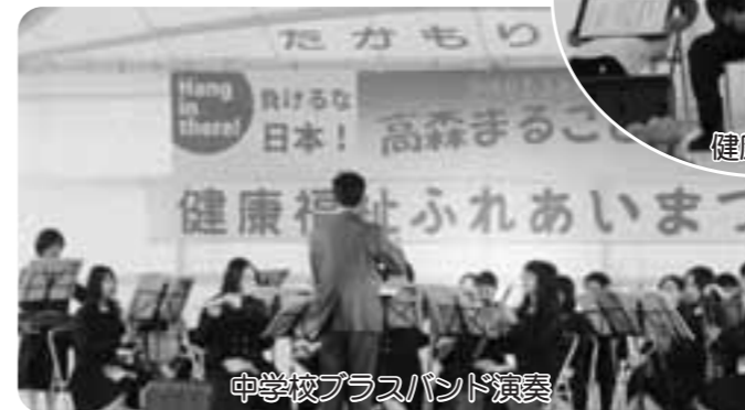
中学校プラスバンド演奏