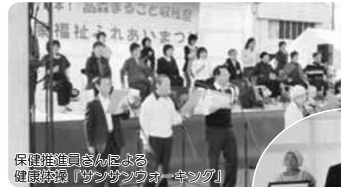
保健推進員さんによる健康体操「サンサンウォーキング」