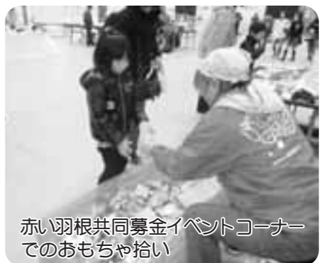
赤い羽根共同募金イベントコーナーでのおもちゃ拾い