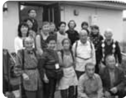
被災地に「ねこ」を届けた皆さん

また、「震災直後の被災地の悲惨な映像が目に焼き付いていたけど、7カ月経った道路などは瓦礫が撤去されており、色々な場面で復興に向けて前進している様子を見ることもできました。全国から駆け付けたボランティアさんの力のすごさ、そして人間の力強さを改めて感じた。」とお話いただきました。 これから本格的な冬の寒さを迎えます。布喜の会の皆さんのあたたかい気持ちで「ねこ」の温もりと共に被災地の方の心にも届けられたのではないのでしょうか。