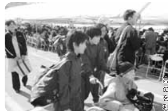
高森荘の利用者さんと36名の中学生のボランティアさんが、一緒に会場を見学。優しい中学生の皆さんと、利用者さんも会話が弾んだ様子です。