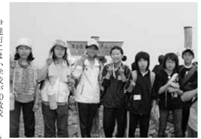
富士見台高原山頂にて

へ入らなければならぬので、洗濯物を外へ干すことや、小雨が降ってきて少しくらい体が濡れても平気ではないけれど、とても不思議な感じが、とても不思議な様子を見て、毎日々生活をしながら大変なとしみじみ感じました。富士見台登山は歩く距離をなるべく短くしたので、ほとんどの子ども達が頂上まで登りきることができました。頂上で食べたおにぎりはとても美味しく、「足りない。」という声が多く聞かれました。子ども達は下山してからも疲れを感じさせず、その後の企画の魚のつかみ取りを何回も楽しんでいました。