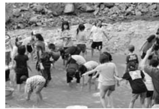
魚のつかみ取りにはしゃぐ子どもたち

伊達市には小学校が30数校あり、それぞれの小学校から集まった小学生が総勢161人参加しました。4泊5日の高原学校の日程は、プール遊びや富士見台登山、オリエンテーリング、最後の夜はキャンプファイヤーなど自然の中の遊びが企画されていました。プール遊びは震災後初めてという子ども達も多くなって、時間終了を告げてもまだ遊び足りない様子でした。福島では放射能の影響で雨が降るとすぐに室内