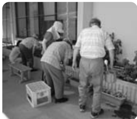
▲園芸クラブ ～苗が成長するのが楽しみです～

このクラブ活動を通して、デイサービスやすらぎ荘で過ごす時間を、有意義なひと時にしていただければと思います。