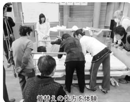
着替えの仕方体験

人間の自然な体の動きを利用した腰に負担の少ない介助方法を分かりやすく教えていただいた後、参加された受講者の方にもベッド上での寝返り、ベッドの上方への移動、車イスへの移乗の実技を、グループに分かれて体験していただきました。