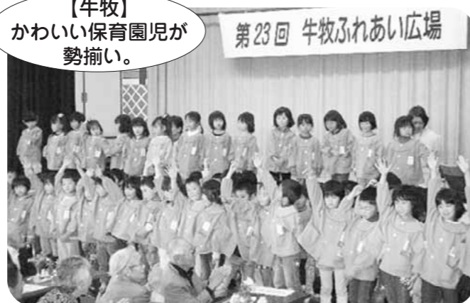
【牛牧】かわいい保育園児が勢揃い。