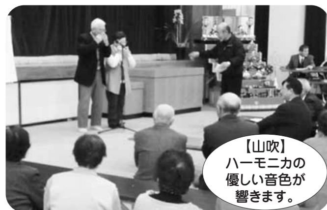
【山吹】ハーモニカの優しい音色が響きます。