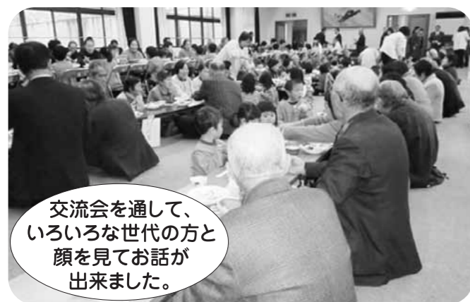
交流会を通して、いろいろな世代の方と顔を見てお話が出来ました。