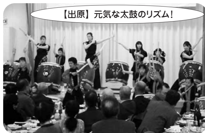
【出原】元気な太鼓のリズム!