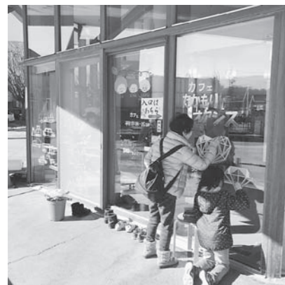
ウィンドウアート

一般の方も多数来場くださり、大盛況のうちに幕を閉じた高森コミュニティフェスタ。ご協力くださった皆さま、本当にありがとうございました。