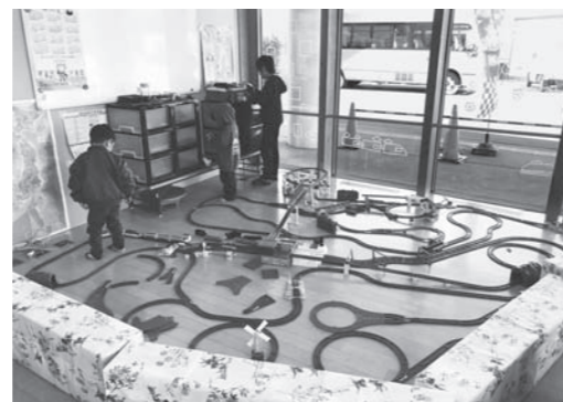
ブラレールコーナー