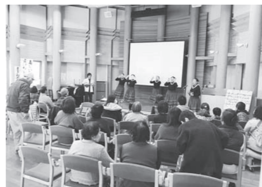
杉の木ホールでのステージ発表